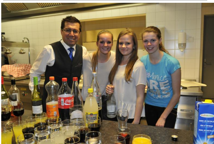
MaS-hulp bij de catering tijdens de beursvloer in Berkelland

Heeft u een ervaring die u wilt delen via de Nieuwsbrief? Laat het de stagemakelaar weten. Een kort stukje tekst met een foto erbij maakt kans op plaatsing. Voor Berkelland en Lochem is het de bedoeling de nieuwsbrief gezamenlijke te maken. Dus organisaties genoeg!